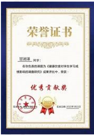
社会实践活动 2 图片(1)