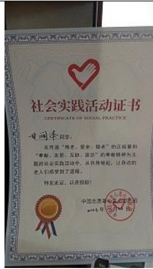
社会实践活动 4 图片(1)